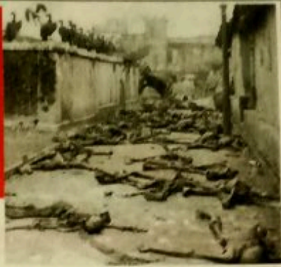
బెంగాల్ క్షామం: పీఠుల్లో కనబడుతున్న గోడలపై రాబందులు

అధునిక చరిత్రలో నరరూప రాక్షసత్వం అనగానే... గుర్తుకొచ్చే పేరు హిట్లర్. కానీ హిట్లర్ కు ఏమాత్రం తీసిపోని... అమానవీయతకు నిలువెత్తు నిదర్శనంలాంటి మరో పేరు... విన్ స్టన్ చర్చిల్! శ్రేణిజాతి దురహంకారంతో భారత స్వాతంత్ర్యాన్ని తుడవకంటా వ్యతిరేకించాడు. అస్పృహతో మించి... బెంగాల్ క్షామంలో తన పాశవిక నిర్ణయాలతో 30 లక్షల మంది భారతీయుల మరణానికి కారణమయ్యాడు.